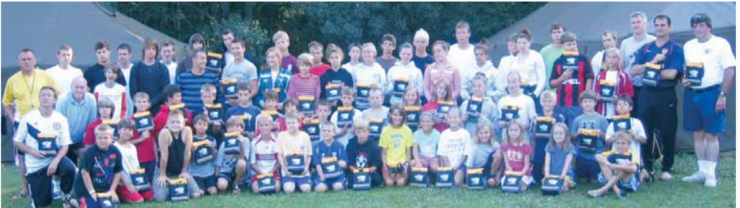
Selfreliance sponsors youth activities such as the annual Ukrainian American Youth Association's Soccer Camp at the "СУМ Оселя" in Baraboo Wisconsin.

4-та Олімпіада Української Діаспори відбулася в Українсько Американському Спортовому Центрі Пенсильванії. "Самопоміч" була спонсором молодшої дружини товариства "Січ".