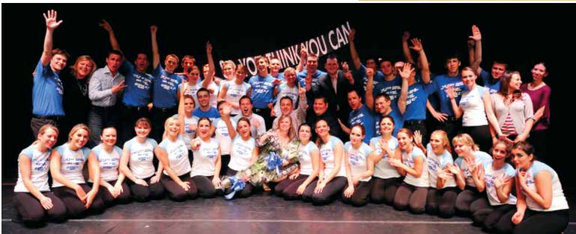
"Hromovytsia" Dance Ensemble, Chicago's ambassador of Ukrainian culture, is proud to have Selfreliance UAFCU as its premier financial sponsor.

Кредитівка "Самопоміч" є головним фінансовим спонсором танцювального ансамблю "Громовиця", який представляє українську культуру міста Чикаго.