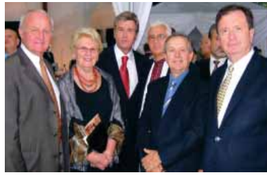
Selfreliance Board members meet with Ukrainian President Victor Yushchenko (top left), First Lady Kateryna Yushchenko (bottom left) and Ukraine's Minister of the Interior Yuriy Lutsenko (below).