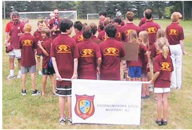
4 th Ukrainian Diaspora Olympiad held at "Truzyb" Ukrainian American Sports Center, PA. "Sitch" NJ Juniors team was sponsored by Selfreliance UAFCU.

Кредитівка "Самопоміч" підтримує різні виховні установи й організації у місцевостях, де живуть її члени.