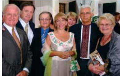
Члени Ради Директорів зустрілися з Президентом України Віктором Ющенком, його дружиною Катериною та з Міністром Внутрішніх Справ України Юрієм Луценком.