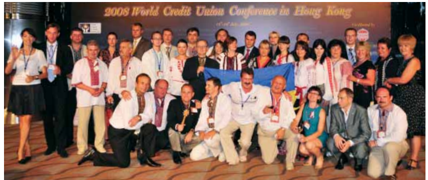
Selfreliance Board members attended the World Credit Union Conference in Hong Kong.