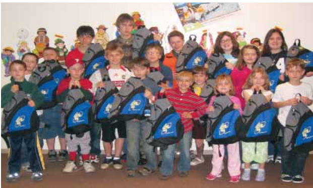
Ukrainian school students receive backpacks from Selfreliance for participating in the School Savings program. "Самопоміч" допомагає учням Шкіл Українознавства бути ощадливими, а своєю участю в програмі ощадності діти допомагають своїй школі. На знімках - учні отримують наплечники в подарунок за участь у програмі.