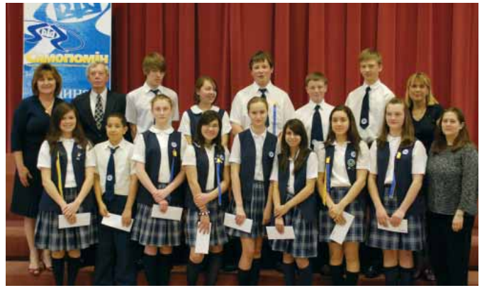
Selfreliance is a major contributor to St. Nicholas Cathedral School. Shown is the 2008 Graduating class holding congratulatory gifts from Selfreliance.

The credit union's School Savings programs and Super Savers Club provide incentives for children to save and their benefits extend beyond the short term reward.