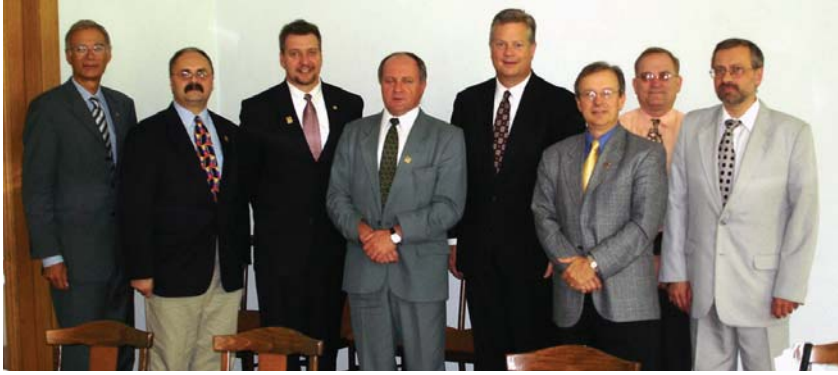
Представники Всесвітньої Ради КС, Центральної КС США та Самопоміч на зустрічі з НАКСУ в Києві. Representatives of the World Council of Credit Unions (WOCCU), US Central CU and Selfreliance meet with Ukrainian National Association of Savings and Credit Unions (UNASCU) in Kyiv to sign an agreement.