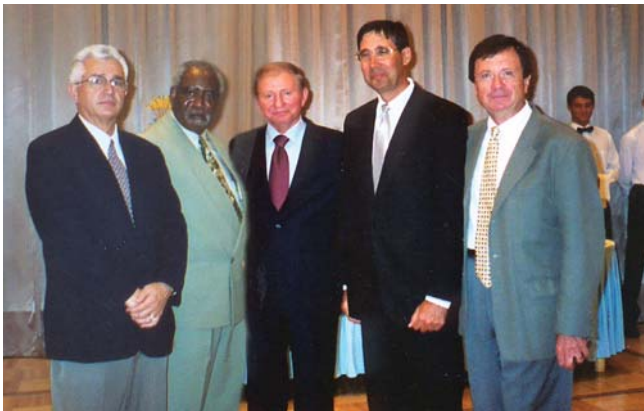
Представники Каси з Конгресманом Денні Дейвіс, Президентом Леонідом Кучмою і Послом Гербстом. Selfreliance representatives with President Kuchma and US Ambassador to Ukraine John E. Herbst.