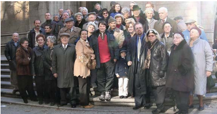
Члени Каси Самопоміч Нью Джерзі після відзначення Голодомору в Катедрі св. Патрика в Нью Йорку. Credit union members in New Jersey participated in Holodomor commemoration at St. Patrick's Cathedral. Their trip was sponsored by Selfreliance.