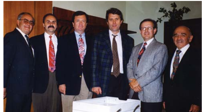
Віктор Ющенко і Президія Дирекції Каси в 1995. Каса "Самопоміч" і Віктор Ющенко вже співпрацюють понад 14 років. Executive committee and Victor Yushchenko in Kyiv in 1995. Selfreliance and President Yushchenko have had a close working relationship for over 14 years.