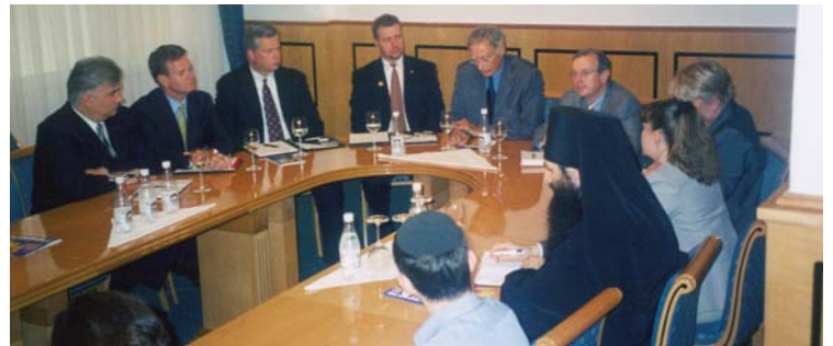
Зустріч провідників кредитних спілок в Україні з представниками церков для обговорення створення кредитівок на підставі релігійних громад.

Discussions with Ukrainian citizens during this time inevitably turned to the October presidential elections. The majority of people were convinced that Victor Yushchenko would be the winner. Who could have anticipated that the elections would be so unique, that they would elicit such an emotional reaction in the hearts of Ukrainians and attract the attention of the entire world to our homeland of Ukraine. As it turns out, their dreams – and ours – were fulfilled!