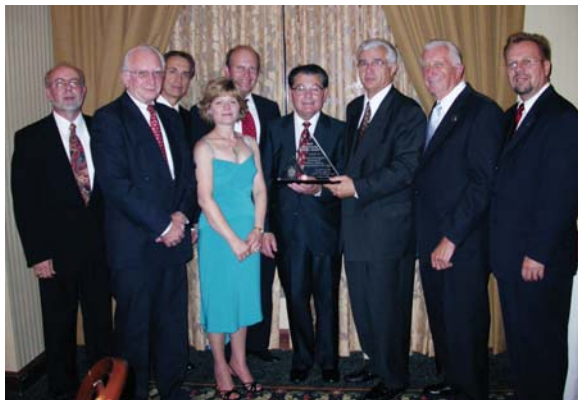
Члени Дорадчого Комітету Каси в Нью Джерзі з проводом Січової Станиці. Members of Selfreliance New Jersey Advisory Committee with leaders of Sich at commemorative banquet.