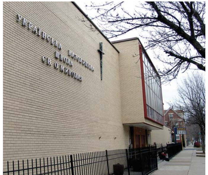
На потреби Катедральної Школи св. о. Миколая, Каса Самопоміч подарувала 50,000 дол. у 2004р. Selfreliance provides continuing support St. Nicholas Cathedral School, with $50,000 of assistance in 2004.