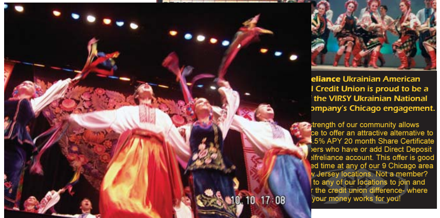
Selfreliance Ukrainian American FCU participated in a number of community festivals throughout the year, so that it could promote its services, distribute premiums to its loyal members and share information about upcoming events. The credit union also sponsored various concerts, such as the appearance at The Chicago Theatre of the Virsky Ukrainian National Dance Company.