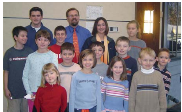
Колядники відвідали бюро Каси в Парсіпані. CYM Carolers visit Selfreliance office in Parsippany.