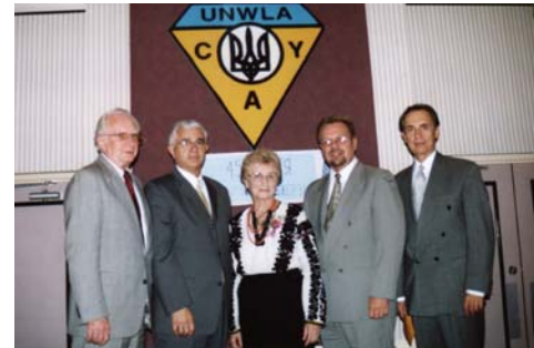
На бенкеті 71-го відділу Союзу Українок Америки в Нью Джерзі. Celebrating with UNWLA Branch 71 in New Jersey.