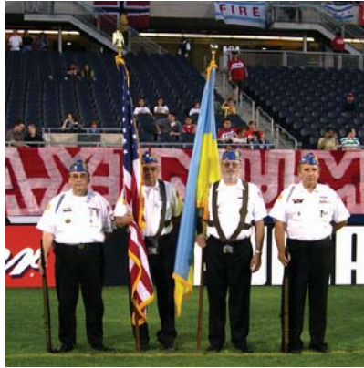
Українські Ветерани несуть прапори на Українському Вечорі з футбольною дружиною Chicago Fire, спонсором якого була Каса "Самопоміч". Color Guard of Ukrainian Veterans at the Selfreliance sponsored Ukrainian Night with Chicago Fire at Chicago's Soldier Field.

Selfreliance Ukrainian American FCU values very highly the efforts of its members to establish various associations and social organizations, since it is these structures which maintain the integrity of the community and, in turn, support the growth in membership of the credit union. Selfreliance helps its members financially, strengthening their economic standing, and supports the Ukrainian-American community institutions to which they belong. In 2004 alone Selfreliance assistance to the community totaled $902,861.