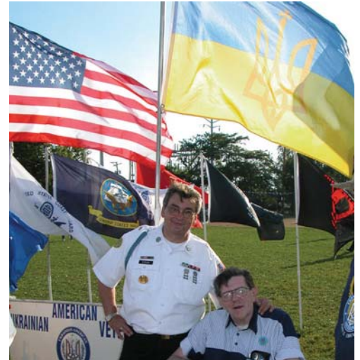
Каса "Самопоміч" допомагає українським ветеранам ознайомити громаду про участь українців у збройних силах США. Selfreliance supports efforts by Ukrainian Veterans groups in promoting their participation in America's armed forces.