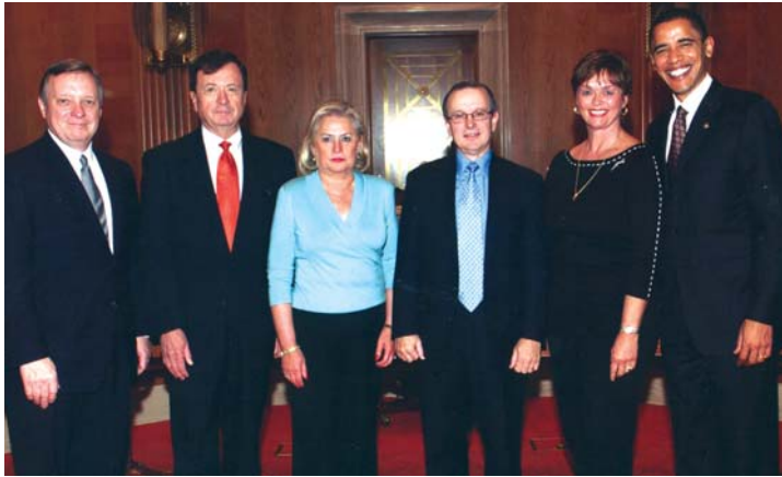
Зустріч у Вашингтоні з сенаторами Ричардом Дурбин і Барак Обама у справі визнання Україні постійного торговельного статусу "Most Favored Nation" Meeting in DC with Senators Dick Durbin and Barack Obama to discuss Permanent Most Favored Nation status for Ukraine

Ми завжди співпрацюємо з нашими публичними урядниками на всіх рівнях, щоб ознайомити їх з потребами і діяльністю нашої громади.