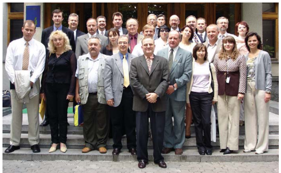
Participants of Conference of International Credit Union Development in Kyiv, sponsored by UNASCU: from Poland, Moldova, Belarus, Lithuania, Russia and Ukraine, with representatives from the US credit union movement. Учасники міжнародної конференції кредитних спілок зорганізованої НАКСУ в Києві. Між учасниками: Польща, Молдова, Білорусь, Литва, Росія і Білорусь та представники кредитного руху США.