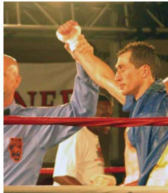
Український чемпіон з боксу Віталій Копитко, з допомогою Самопомічі, поширює дух українського спорту та працює з дітьми, майбутніми членами спортивного клубу в Чикаго. Selfreliance sponsored efforts by Ukrainian middleweight boxing champion Vitaly Kopytko to raise awareness of the Ukrainian community and to begin a youth sports association in the Chicago area.