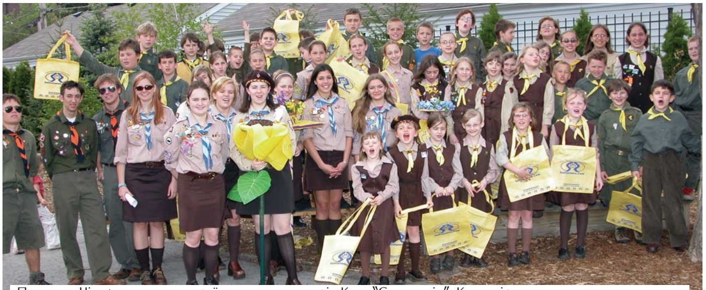
Пластуни Чикаго пишаються своїми подарунками від Каси "Самопоміч". Кредитівка щороку допомагає нашим українським організаціям молоді у їхній праці. При цій нагоді на потреби Пласту передано 5000 дол. Members of Plast in Chicago show off the gifts they received from Selfreliance. The credit union provides ongoing, generous support to the Ukrainian youth organizations. At this event Plast received a check for $5000.

Shown are the children's Dynamo teams with the mascot of the Chicago Fire.