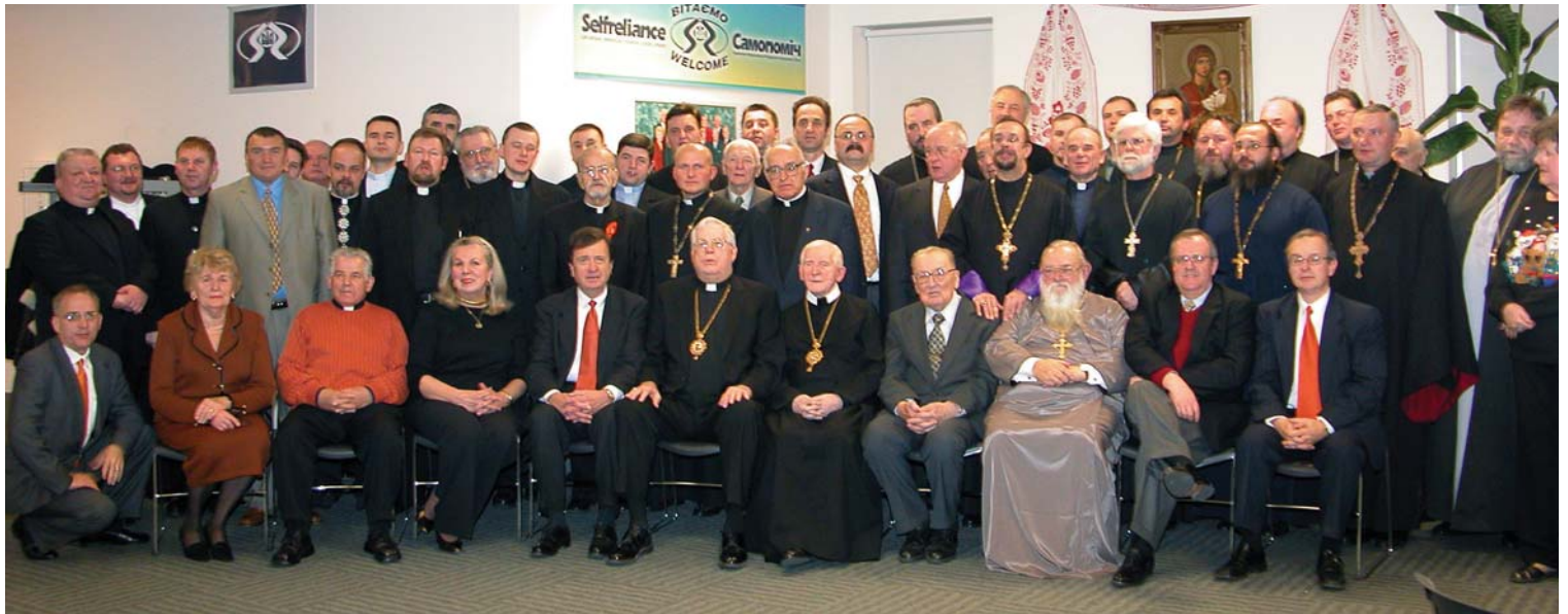
Різдвяна зустріч у Касі "Самопоміч" проводу кредитівки з представниками українських релігійних громад Чикаго й околиць. Representatives of Ukrainian Churches and religious communities of Chicago meet with Selfreliance leaders during the holiday season.