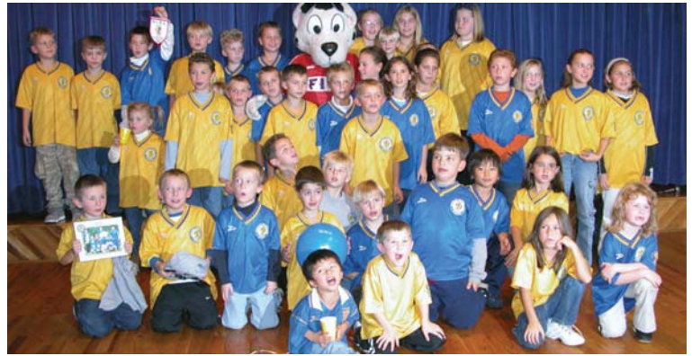
Самопоміч є спонсором дитячих спортивних дружин. На світліні: члени дитячої футбольної дружини "Динамо". Selfreliance supports our younger sports teams.

Selfreliance occupies a special place within the rich mosaic that is Ukrainian life in Chicago. Its role is not only that of a financial and economic institution, but also a community leader. As a democratically run cooperative institution, it continues to be "wholly owned" by its Ukrainian-American membership. The credit union unites its members, no matter what their religious, political or ideological background may be, and will always remain a cornerstone of Ukrainian life.