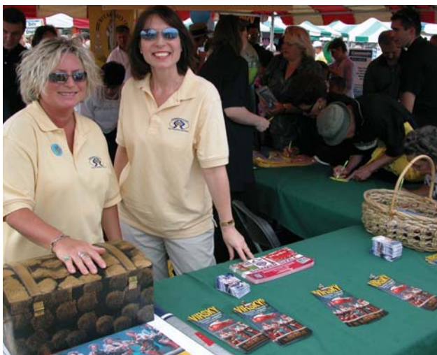
Кредитівка "Самопоміч" користалася з різних громадських фестивалів протягом року, щоб розказати про свою установу і роздати відвідувачам різні подарунки. Каса також була спонсором ряду концертів, як напр. виступу Танцювального Ансамблю ім. П. Вірського.