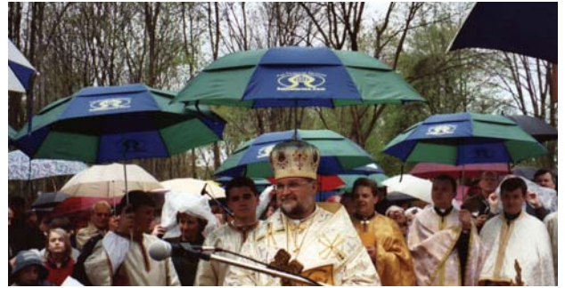
Море парасоль "Самопоміч" на посвяченні в Нью Джерсі A sea of Selfreliance umbrellas in New Jersey

Кредитівка "Самопоміч" не тільки фінансово-господарська інституція, але одночасно і провідна громадська установа. Членами-власниками Каси "Самопоміч" є люди виключно з української громади, тому наша Кредитівка, як демократична кооперативна установа, залишається вповні власністю тільки української громади. "Самопоміч" об'єднує членів, згуртовуючи всіх, без уваги на їхні релігійні, ідеологічні чи політичні переконання.