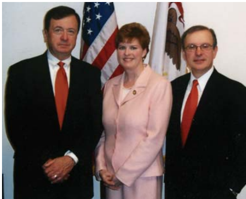
При зустрічі з членом Конгресу зі стейту Ілліной Мелісою Бін Meeting with Congresswoman Melissa Bean from Illinois.