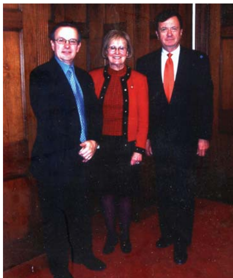
На зустрічі з членом Конгресу зі стейту Ілліной Джуді Бигерт. A meeting with Congresswoman Judy Biggert from Illinois.